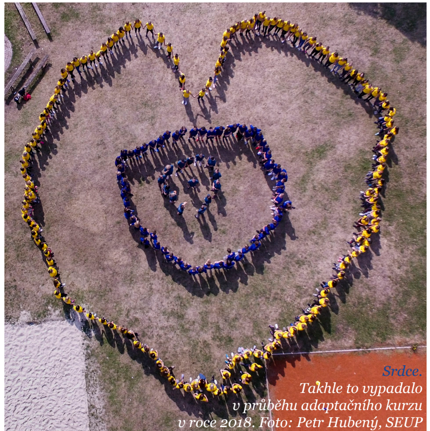
Srdce. Takhle to vypadalo v průběhu adaptačního kurzu v roce 2018.

Po příjezdu do areálu jsme dostali čas se zabydlet a trochu se i mezi sebou seznámit. Odpoledne nás už čekal program. Jako první jsme měli seznamování s našimi třídními učiteli. Dozvěděli jsme se něco o chodu školy a jak to celé bude probíhat. Poté na nás čekal proslov pana ředitele a představení ostatních učitelů. Podrobnější seznamování s učiteli jsme absolvovali v dalších dnech. Navečer Pokračování na straně 2