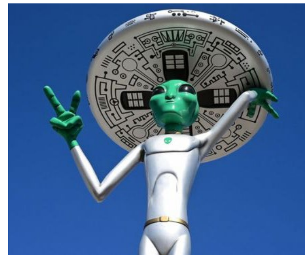
Lidstvo miluje konspirační teorie. Kolik z nich je pouhou pohádkou a kolik vychází z pravdy?

Tato kauza vzbuzuje spoustu otázek, na které nelze přímo odpovědět. Kde je tedy pravda? Snaží se Spojené státy něco zatajit, nebo jen lidská fantazie nezná mezí? Je jen otázkou času, než do areálu proniknou obyčejní lidé a zjistí, co se za branami nevadské pevnosti Area 51 skutečně skrývá.