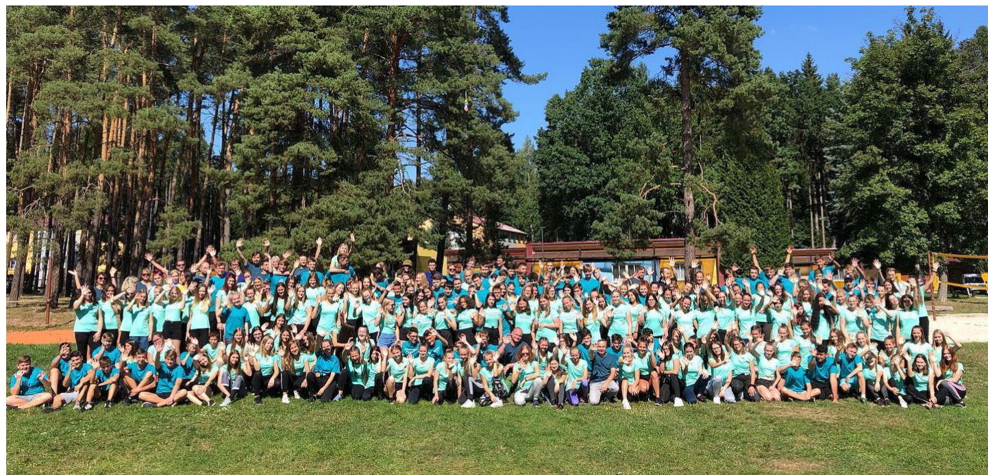
Každý rok k nám přijde mnoho nových tváří. Je týden na seznámení dost?

Myslíme, že adaptační kurz byl úžasný, a naši studenti si ho určitě velmi užili. Musíme poděkovat vedení školy za celou organizaci a uskutečnění! Přejeme všem prvákům hodně štěstí při studiu!